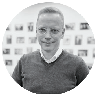
Эрнест Мацкявичюс — директор Института медиа НИУ ВШЭ, журналист, ведущий программы «Вести в 20.00» на телеканале «Россия»